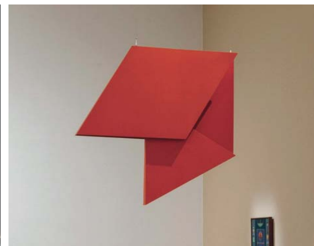
Hélio Oiticica, från serien "Reliefe i rummet", (1959/1991).