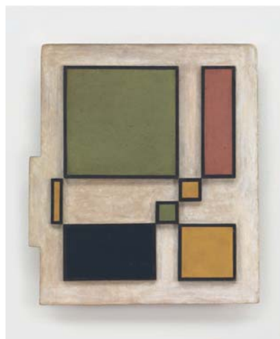
"Cuadrilongo amarillo (Gul kvadrilong)", av Rhod Rothfuss, (1955).